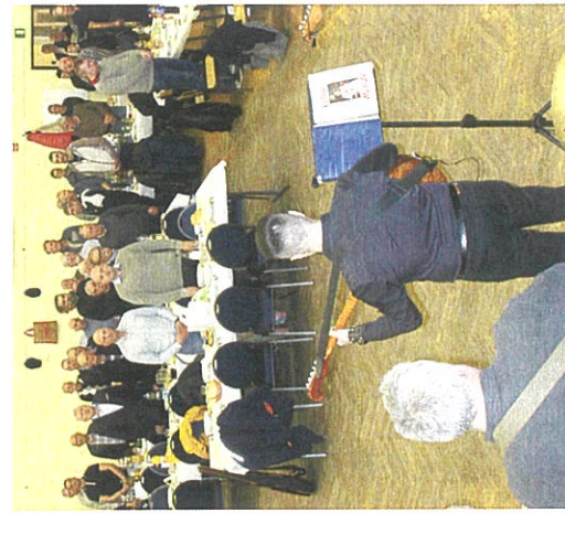
Muško prelo u Gari