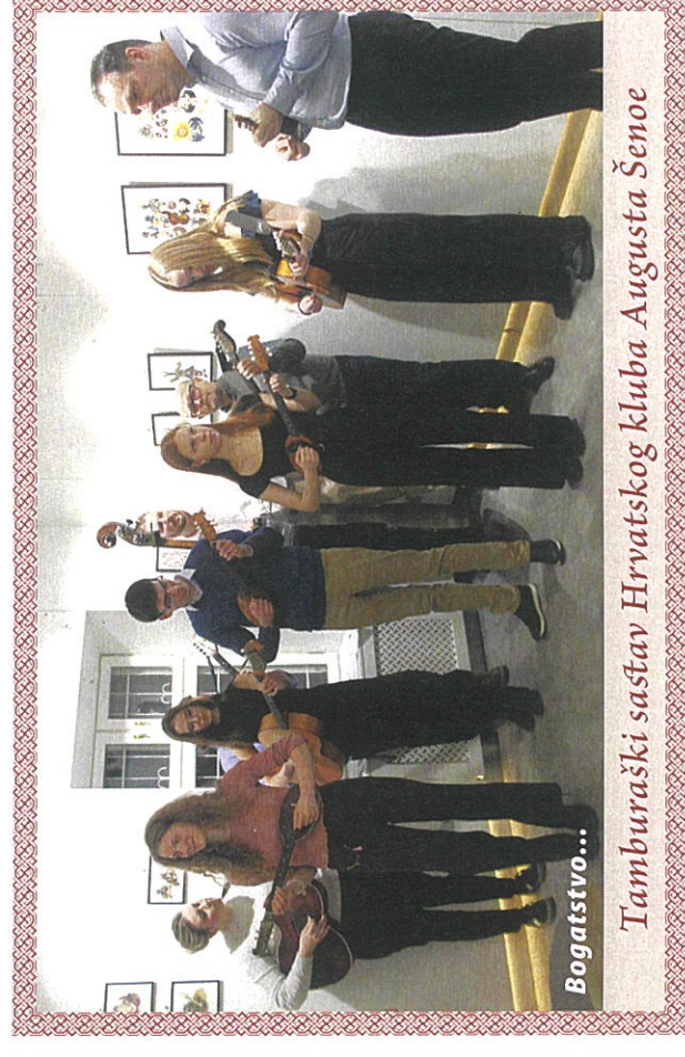
Tamburaški sastav Hrvatskog kluba Augusta Šenoae