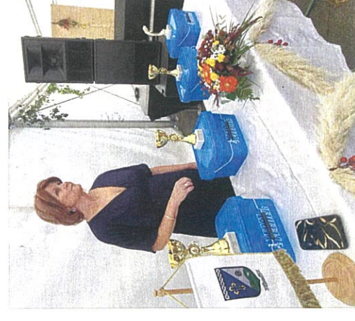
Kukinj – predgrađe Pečuha